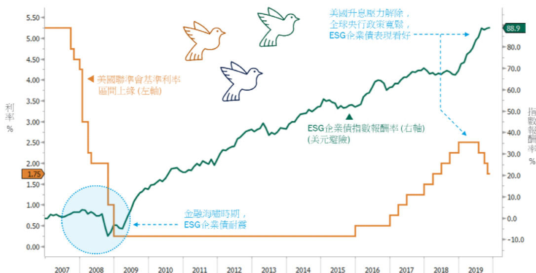
货币宽松环境下，ESG 债券表现看好 数据源：Bloomberg

而在其中，ESG 投资的表现却出人意料。在下跌的市场中，ESG 基金尽管也无可避免的下行，却展现出了非同一般的韧性。根据彭博社最新数据分析，虽然新冠肺炎疫情冲击造成美股大跌，然而 ESG 相关基金的跌幅却不到美股的一半 。