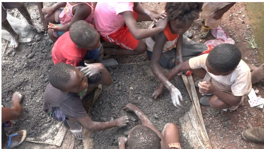
刚果金矿场的儿童