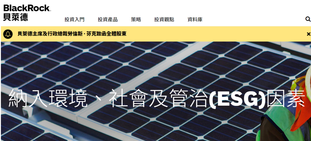
全球最大的资产管理公司 BlackRock 计划深入转型 ESG

2006 年，联合国责任投资原则组织 UN-PRI 成立，ESG 理念在全球得到了大力推广。截至 2019 年 4 月，UN-PRI 已覆盖 60 多个国家或地区，拥有接近 2400 家机构作为签署方，涵盖的资产管理规模总额突破 85 万亿美元。2017 年开始，中国也陆续有近 30 家机构签署了联合国责任投资原则。